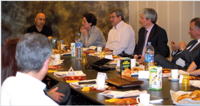
Imagen del desayuno de trabajo celebrado en la sede de Caja Navarra